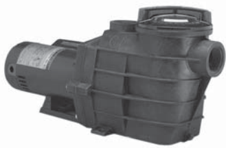
Relación de partes en Sección de Refacciones